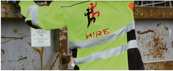
Utrygt: Bemanningsbransjen.