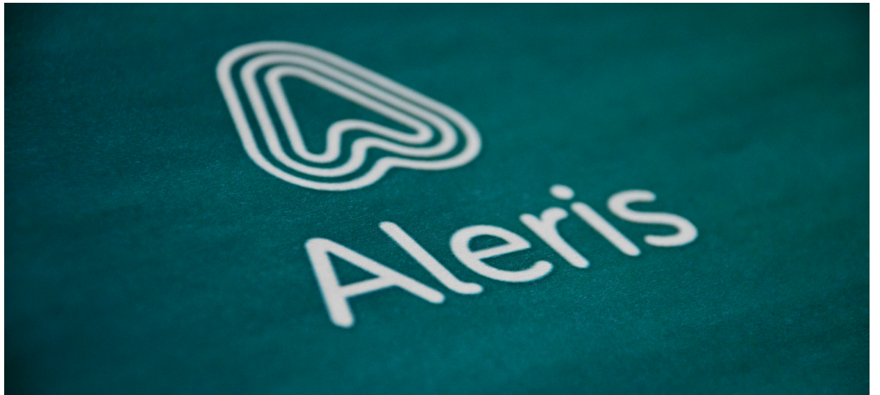
Saksøkt: Aleris Ungplan & Boi AS.