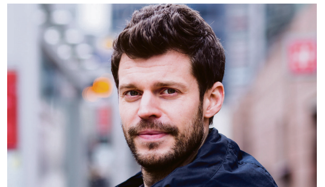
Rødt-leder: Bjørnar Moxnes.

– De bruker argumentet om brukernes beste til å frata de ansatte forhandlingsretten. I praksis er